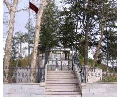
ANITKAYA ŞEHİTLİĞİ / ANITKAYA