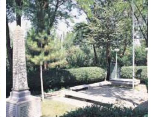
YILDIRIM KEMAL ŞEHİTLİĞİ / SİNANPAŞA