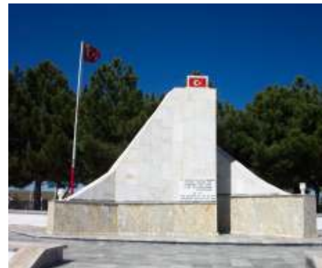
GİRESUNLULAR ŞEHİTLİĞİ / İSCEHİSAR