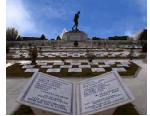
BÜYÜK TAARRUZ ŞEHİTLİĞİ / SİNANPAŞA