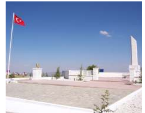
ALBAY REŞAT ÇİĞİLTEPE ŞEHİTLİĞİ / SİNANPAŞA