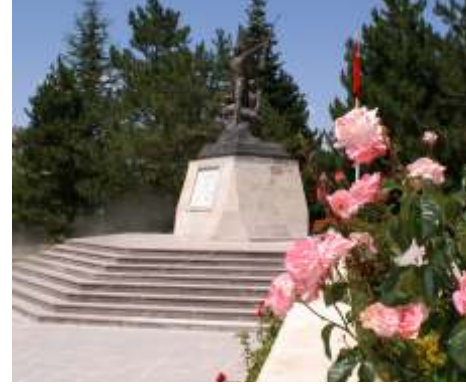
YZB. AġAH EFENDİ ŞEHİTLİĞİ / KOCATEPE