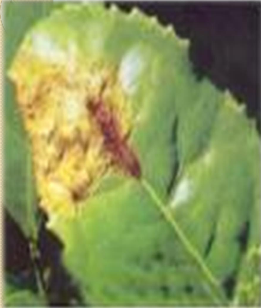
⊞ Dışık yaprak yanıklığı